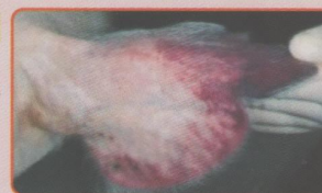
Цианоз кожи уха свиньи, больной АЧС