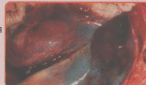
Увеличение почки и мышечные гемorragии при АЧС